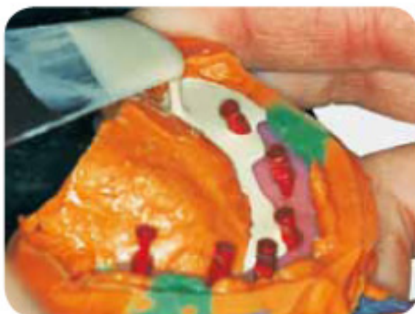
待Gi-mask人工牙龈固化后，直接在其上灌制石膏模型。