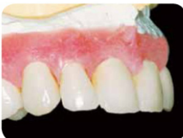
在模型上制作完成的修复体。