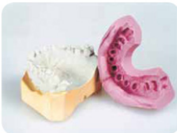
使用Lab-Putty技工用硅橡胶制作模板。