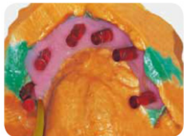
理想的粘稠度和加压触变性，材料不会乱流。