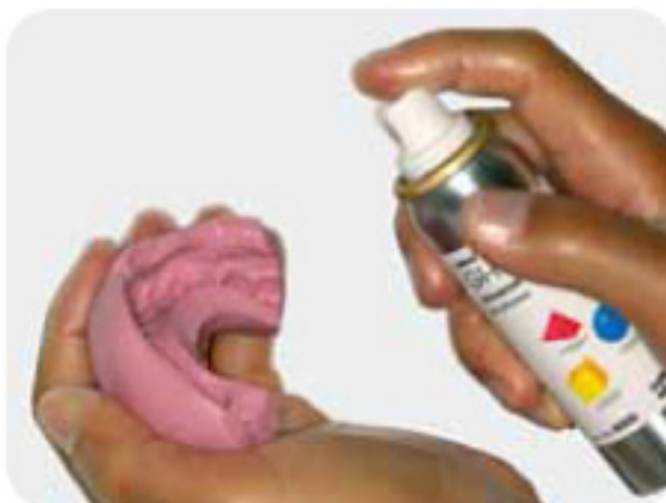
向模板喷涂Gi-mask分离剂。