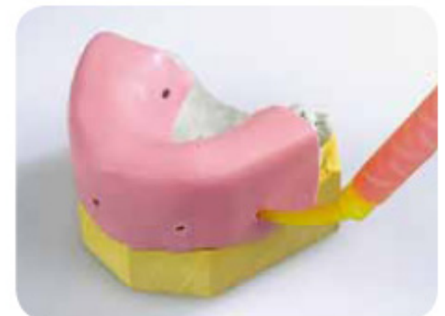
通过预先钻好的小孔向模板内注射Gi-mask牙龈复制硅橡胶。