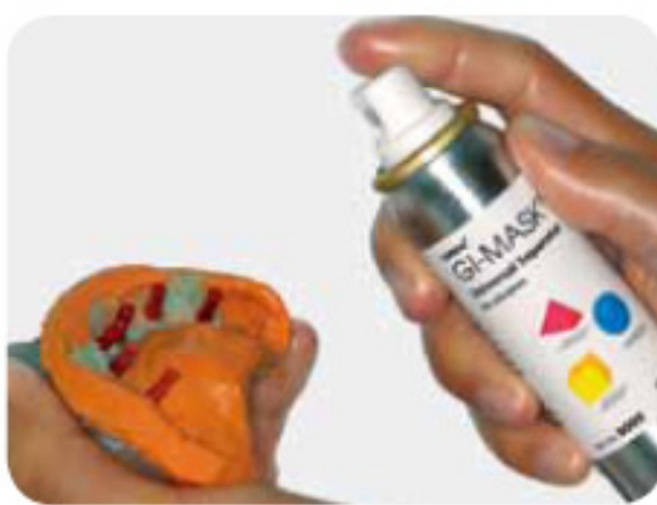
向印模喷涂Gi-mask分离剂。