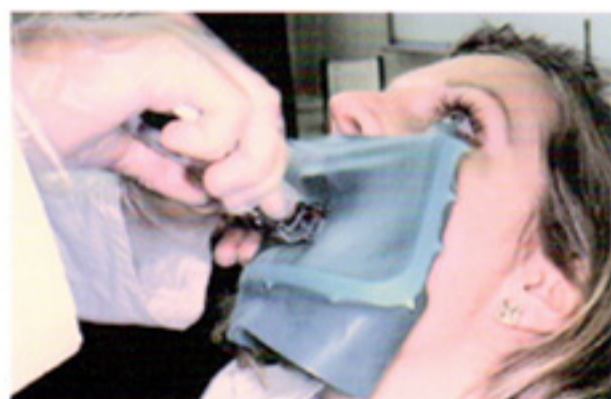
将橡皮障夹连同支架一起就位, 操作简便。