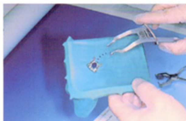
用手或者橡皮障夹钳将有翼橡皮障夹安放在橡皮布上。