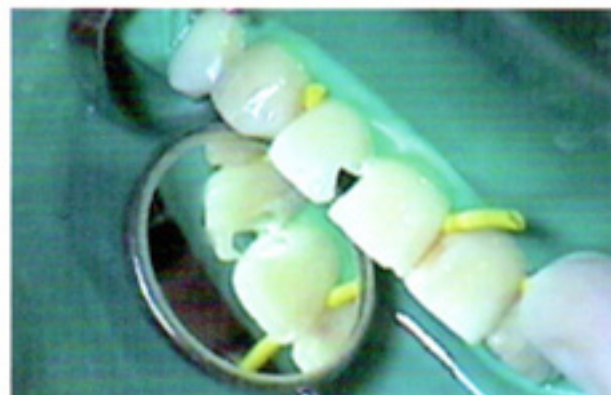
Wedjets ® 固定楔线同样可以提供可靠、简便的固位。