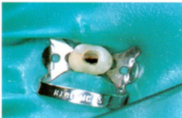
根管治疗时, 可获得极佳的视野和操作进路。