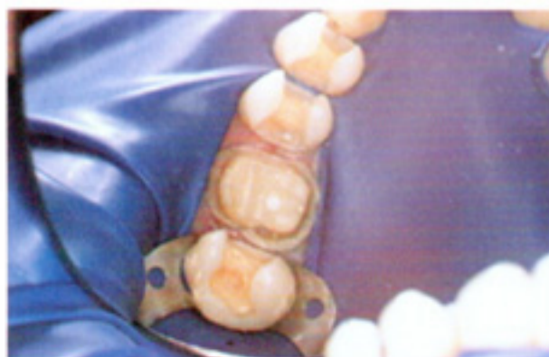
橡皮障甚至可用于龈下预备。