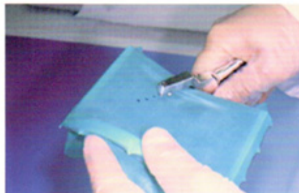
首先使用橡皮障定位模板在橡皮布上作好牙位标记, 将橡皮布绷在 Hygenic ® 橡皮障支架上。转动橡皮障打孔器的孔位圆盘选择适当大小的孔位, 然后在预先标记好的位置上打孔。