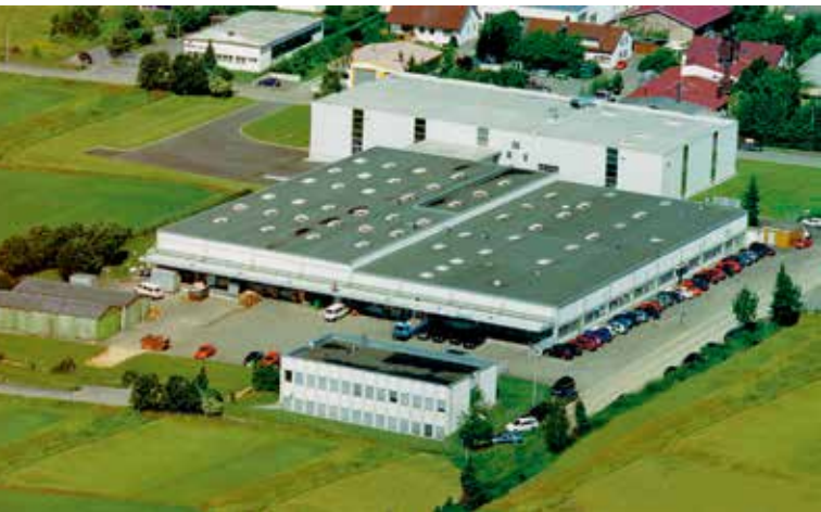
位于Langenau工厂和办公室